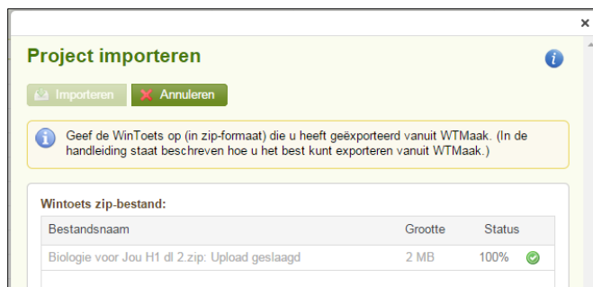
Figuur: Wanneer het groene vinkje verschijnt is het project geïmporteerd.