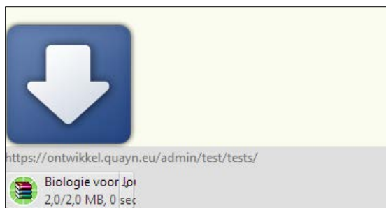
Figuur: Bij elke browser zal het exporteren er anders uitzien.

Uw webbrowser download een zip-bestand. Hieronder een voorbeeld, zoals Chrome het downloaden weergeeft onder in het scherm.