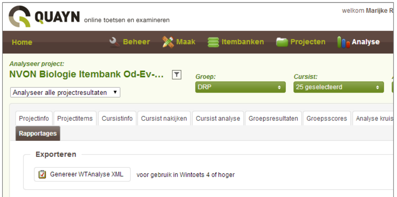
Figuur: Analysebestand uit Quayn extraheren.