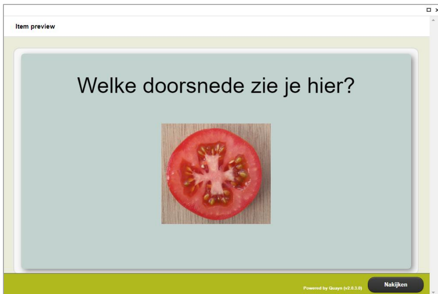
Figuur: Flashcardvraag met de 'voorkant' van de kaart met een vraag.

Bij het itemtype 'Flashcard' kan de cursist digitaal 'een kaart omdraaien'. Op de kaart staat een vraag, vreemd woord of stelling. De cursist beantwoordt de vraag in zijn hoofd en kan daarna het antwoord bekijken.