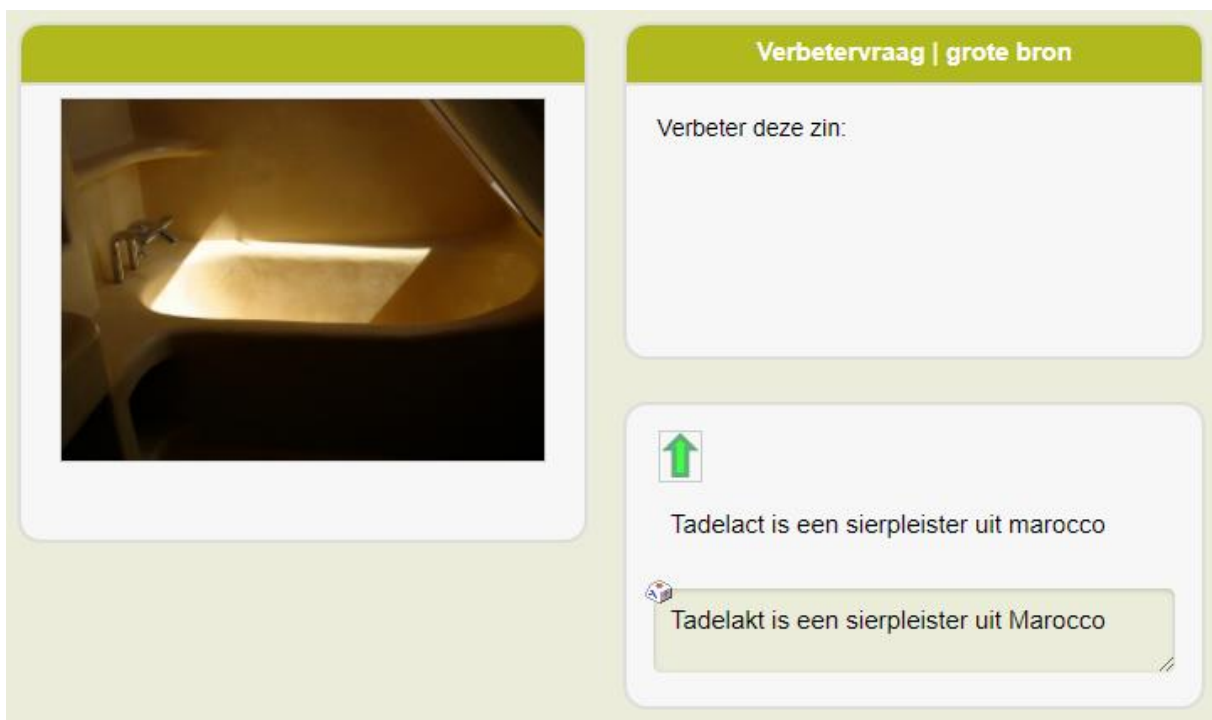
Figuur: Verbetervraag met een zin met fouten erin, en het gegeven antwoord.

Bij het itemtype Verbeter krijgt een cursist een tekst aangeboden waarin syntaxis- en/of grammaticafouten staan. De cursist dient deze tekst te verbeteren. Daarbij kan hij/zij voortdurend de onbewerkte (foutieve) tekst raadplegen, zoals in de uitvergroting hieronder te zien is. De tekst met de groene pijl is de originele tekst inclusief fouten.