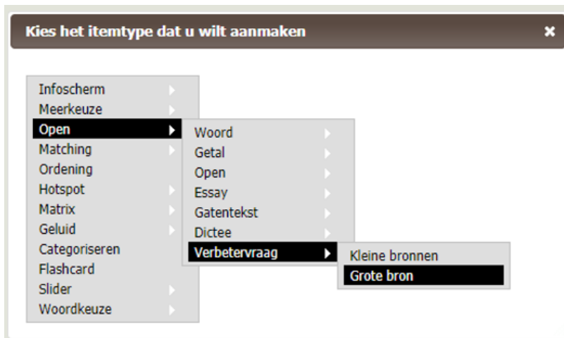
Figuur: Het itemtype Verbetervraag samen met de andere extra vraagtypes die beschikbaar zijn onder de licenties PLUS en hoger.