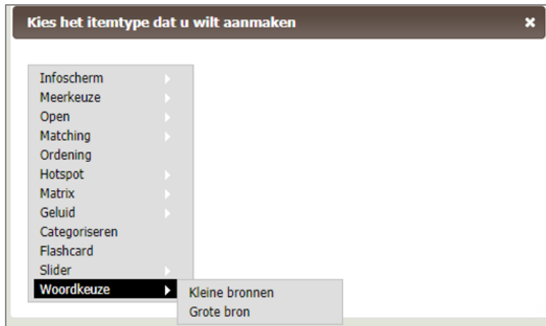
Figuur: Het itemtype Woordkeuze samen met de andere extra vraagtypes die beschikbaar zijn onder de licenties PLUS en hoger .