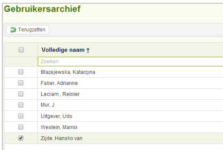
Figuur: Het gebruikersarchief.