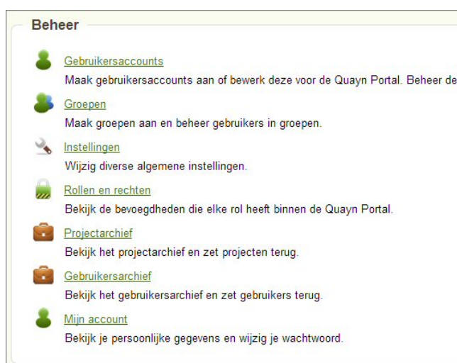
Figuur: Het menu onder Beheer .