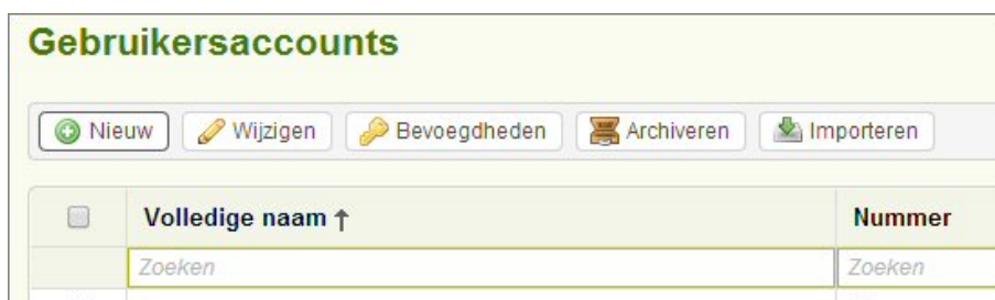
Figuur: Standaard staan de Gebruikersaccounts op alfabetische volgorde.