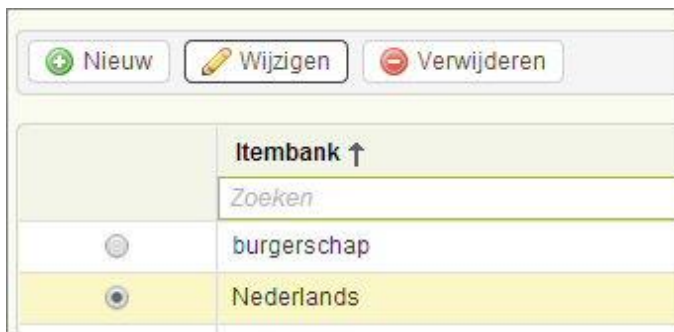
Figuur: Wijzigen itembank