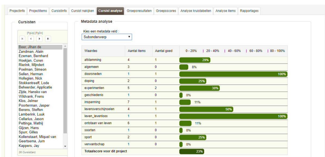
Figuur: Project analyseren.