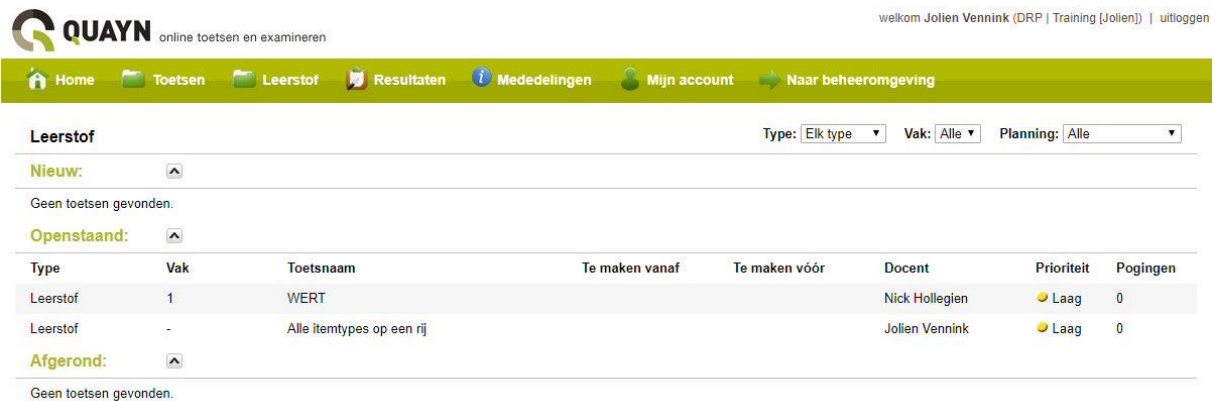
Figuur: Project maken als cursist.