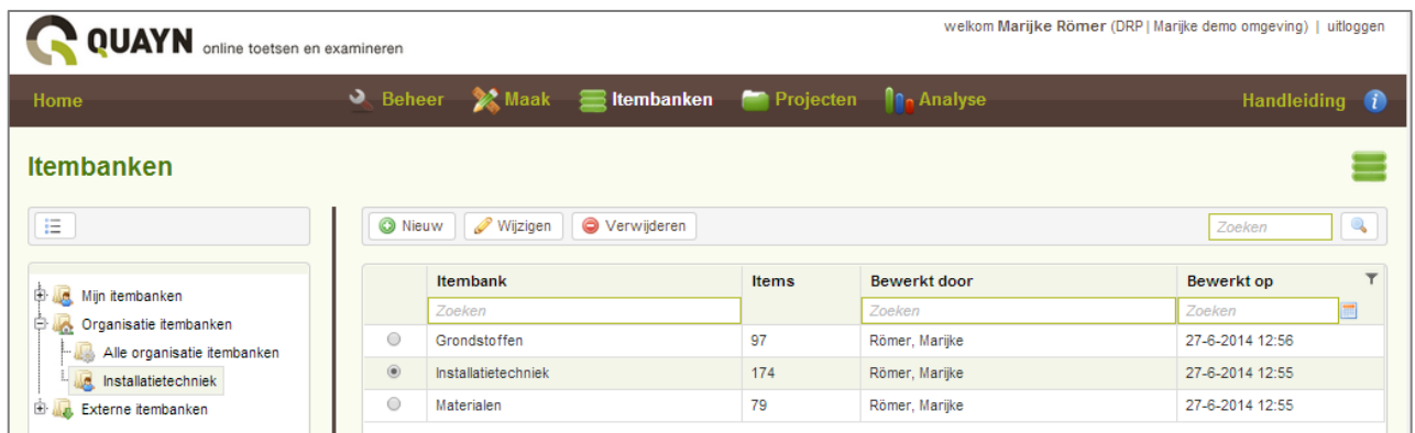
Figuur: Itembank selecteren waarmee u wilt gaan werken.