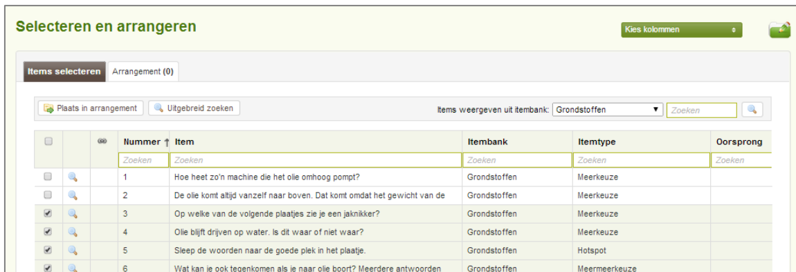
Figuur: Van itembank naar arrangement.